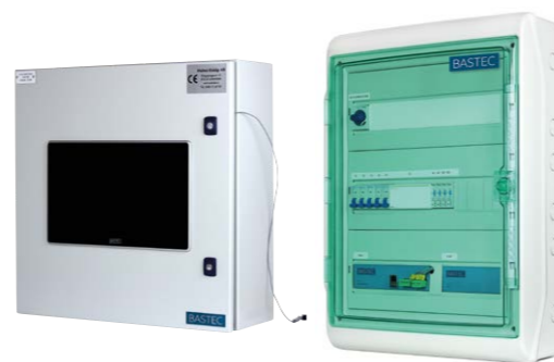
Färdiga plåtskåp och normkapsling med BAS2. Finns även som OEM-lösningar och prefab styr.

”Användare uppskattar att de inte har några löpande kostnader samt att de fritt kan välja vilken leverantör som ska sköta och ”drifta” anläggningen. Utan att binda upp sig i dyra avtal eller bli låsta till en leverantör om anläggningen ska göras om eller utökas.”